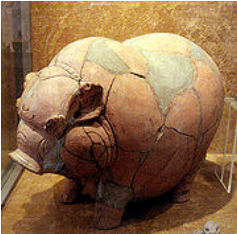
Tirelire cochon en terre cuite de l'empire du Majapahit, datant du 14 e /15 e siècle, du village de Trowulan, en Java Est (Indonésie). Objet de la collection du Musée national d'Indonésie.